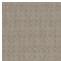
Stoff ST - Step / Gabriel Colori disponibili: 10