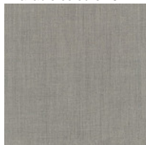
Fabric RM - Remix 3 / Kvadrat Available colours 10