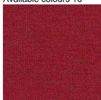
Fabric MF - Main Line Flax / Camira Available colours 10