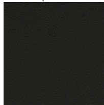
Tejido recubierto SC - Secret / Flukso Colori disponibili: 3

Questo prodotto è garantito 5 anni. Sitland Spa si riserva di apportare modifiche e/o migliorie di carattere tecnico ed estetico ai propri modelli e prodotti in qualsiasi momento e senza preavviso. Le foto e i colori visualizzati sono puramente indicativi e possono variare rispetto alla realtà. Per maggiori informazioni si prega di contattare il nostro Servizio Clienti service@sitland.com