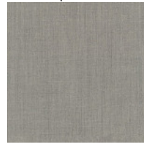
Tela RM - Remix 3 / Kvadrat Colori disponibili: 10