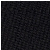
Tela CH - Chili / Gabriel Colori disponibili: 10