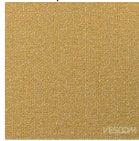
Tela FT - Foster / Vescom Colori disponibili: 7