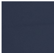
Cuero TS - Florida / Dani Colori disponibili: 12