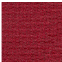
Tissu MF - Main Line Flaxe / Camira Colori disponibili: 10