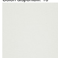
Tissu S1 - Steelcut 3 / Kvadrat Colori disponibili: 13