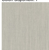
Tissu FD - Fiord 2 / Kvadrat Colori disponibili: 7