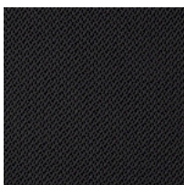
Maille filer TT Colori disponibili: 1

Questo prodotto è garantito 5 anni. Sitland si riserva di apportare modifiche e/o migliorie di carattere tecnico ed estetico ai propri modelli e prodotti in qualsiasi momento e senza preavviso. Le foto e i colori visualizzati sono puramente indicativi e possono variare rispetto alla realtà. Per maggiori informazioni si prega di contattare il nostro Servizio Clienti service@sitland.com