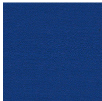
Tissu AB - Xtreme Plus / Camira Colori disponibili: 10