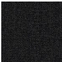
Tissu ME - Medley / Gabriel Colori disponibili: 13

Questo prodotto è garantito 5 anni. Sitland Spa si riserva di apportare modifiche e/o migliorie di carattere tecnico ed estetico ai propri modelli e prodotti in qualsiasi momento e senza preavviso. Le foto e i colori visualizzati sono puramente indicativi e possono variare rispetto alla realtà. Per maggiori informazioni si prega di contattare il nostro Servizio Clienti service@sitland.com