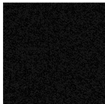
Tissu SY - Sinergy / Camira Colori disponibili: 7