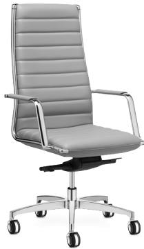
Vega L fauteuil de direction