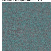
Tessuto SY - Sinergy / Camira Colori disponibili: 10