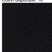
Tessuto CH - Chili / Gabriel Colori disponibili: 10