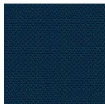
Tessuto AL - Alba / FIDIVI Colori disponibili: 10