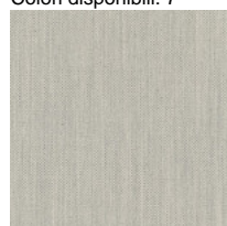
Tessuto FD - Fiord 2 / Kvadrat Colori disponibili: 7