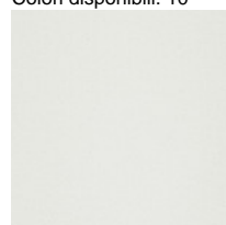
Tessuto S1 - Steelcut 3 / Kvadrat Colori disponibili: 13