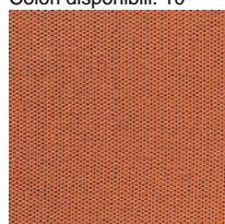
Tessuto WI - Wilson / Vescom Colori disponibili: 10