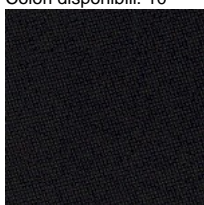
Tessuto CH - Chili / Gabriel Colori disponibili: 10