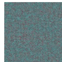
Tessuto SY - Sinergy / Camira Colori disponibili: 10