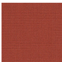
Tessuto CS - Crisp / Gabriel Colori disponibili: 10